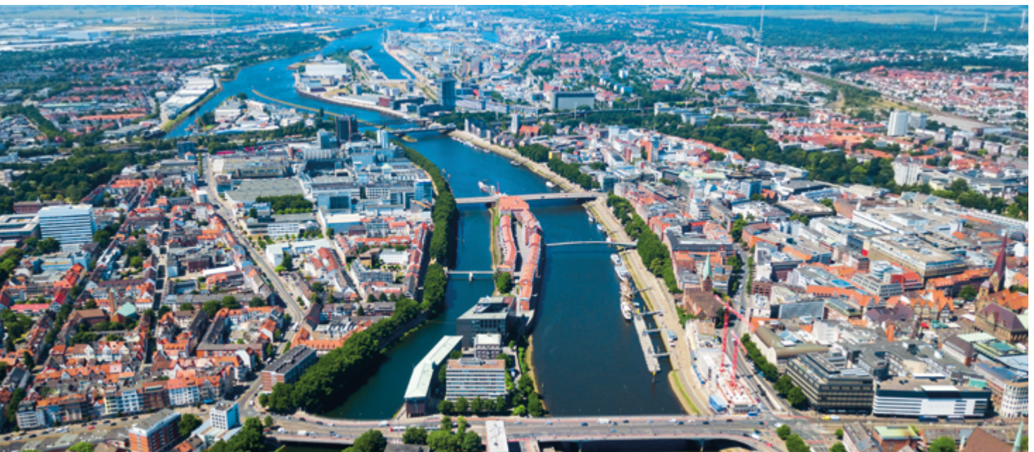
Bürogebäude der HTB Group in Bremen und Luftaufnahme der Bremer Innenstadt, im Hintergrund der Stadtteil Überseestadt (Sitz der HTB Group)